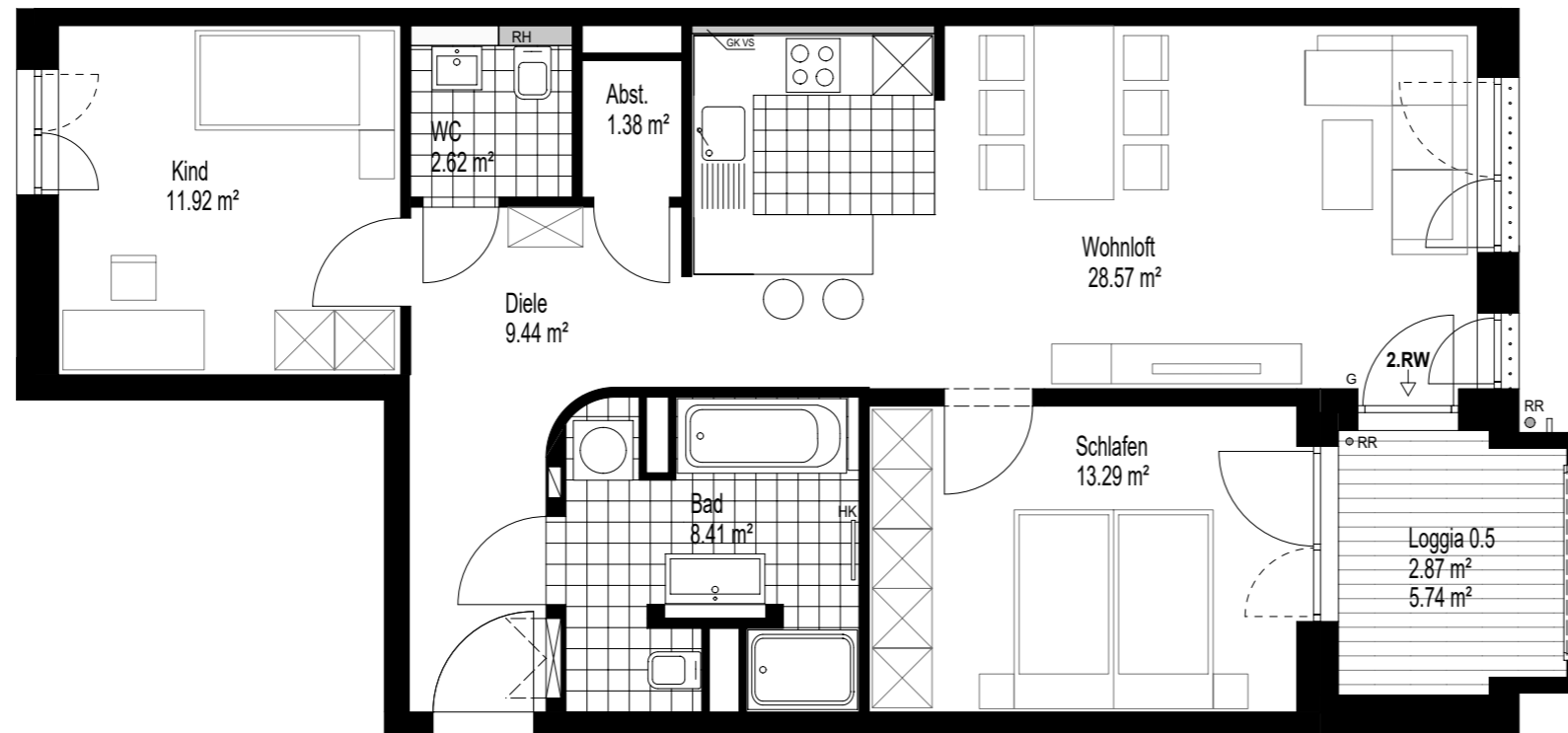
Whg. G-23 78.50 m 2