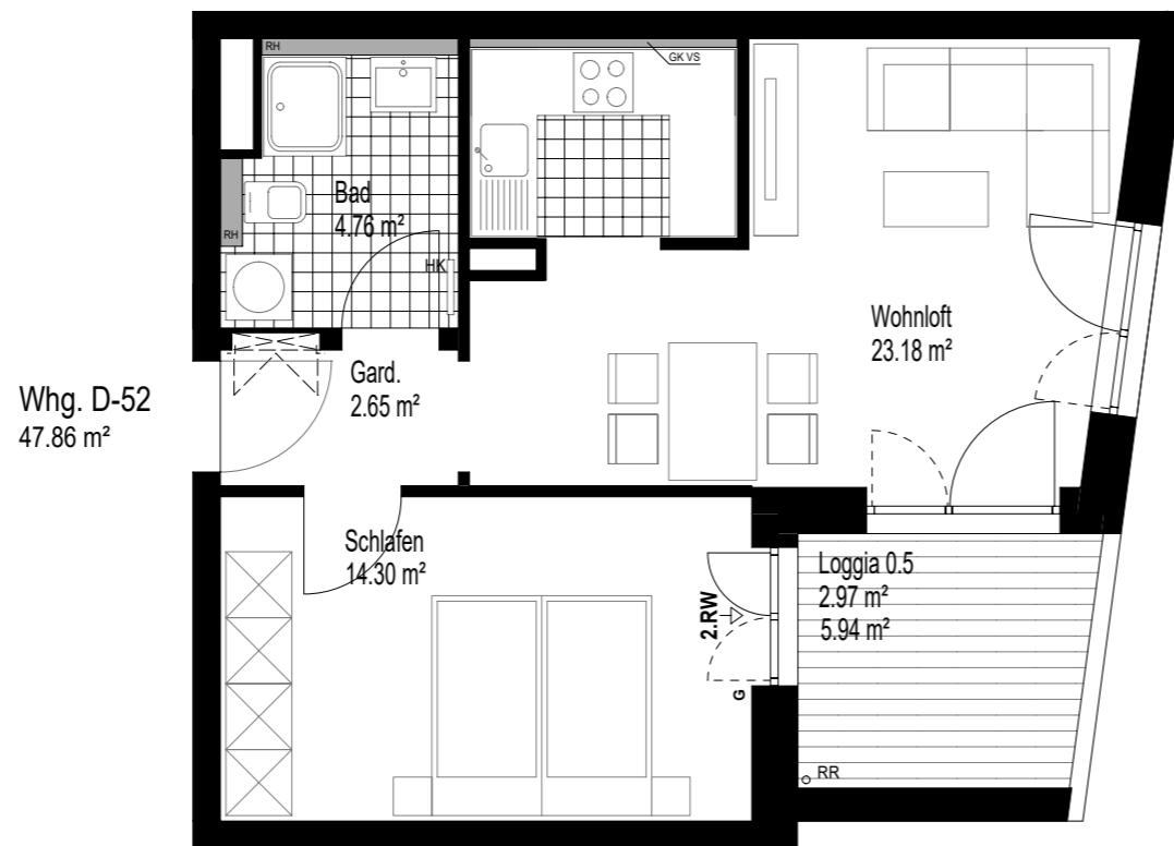
Whg. D-52 47.86 m 2