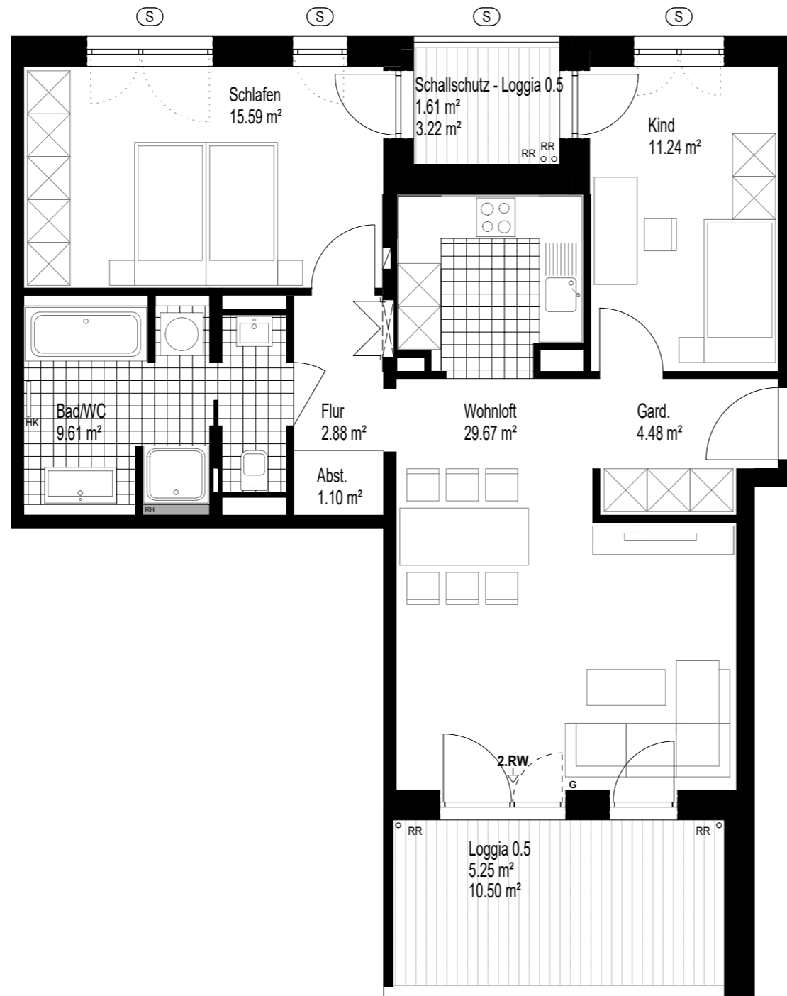
Whg. B-33 81.43 m²